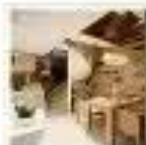
Living Room 客厅