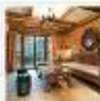
Dining Room 餐厅